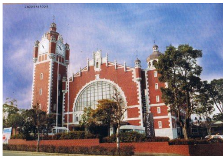
Pałac Ślubów w japońskim mieście Imari

Jako ciekawostkę przytoczyć można fakt, że dzięki majestatowi i przebogatej historii Dworca Głównego, na całym świecie znajdują się chętni na skopiowanie jego bryły, z lepszym bądź gorszym skutkiem. Jednym z takich przypadków jest Pałac Ślubów w japońskim mieście Imari, będący praktycznie pomniejszoną wersją gdańskiego dworca!