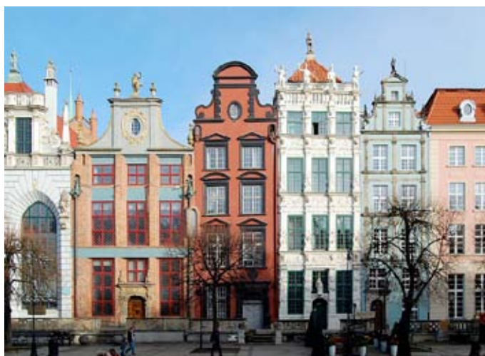
Ul. Długi Targ

Plac zamyka Zielona Brama. Obiekt wzniesiony w latach 1564–1568 zastąpił wcześniejszą, dużo skromniejszą Bramę Kogi. Ze względu na lokalizację i reprezentacyjny charakter budowli rozważano ulokowanie w niej pałacu królewskiego. Ostatecznie nocowała tutaj jedynie królowa Ludwika Maria Gonzaga, kiedy przybyła