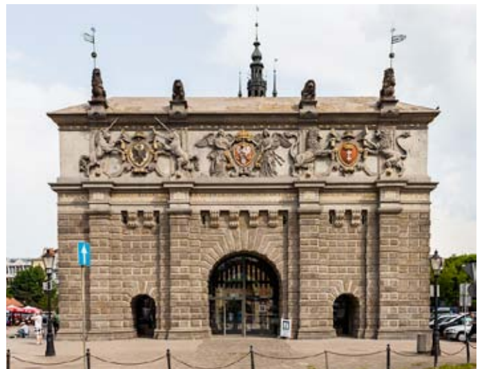
Ul. Wały Jagiellońskie

Na Bramie Wyżynnej, tak jak w wielu miejscach Gdańska, znaleźć można trzy herby. Środkowy to herb Polski. Na piersi orła widzimy mniejszy herb królewski. Nie jest to jednak godło Wazów, którzy rządili w Polsce w 1588 roku, lecz Ciołek, herb rodu Poniatowskich. Z Poniatowskich wywodził się ostatni król Polski, Stanisław August. Przyszły władca urodził się w 1732 roku w niewielkiej miejscowości Wołczyn, położonej obecnie na Białorusi. Był synem Stanisława i Konstancji z Czartoryskich, aktywnie udzielających się w sferze polityki. Ambitni małżonkowie pragnęli, aby ich dzieci zrobiły karierę. Stanisław August odniósł największy sukces, został królem. Jego rodzeństwo także piastowało wysokie urzędy. Aby dzieci mogły zająć znaczące stanowiska, Poniatowscy musieli im najpierw zapewnić odpowiednie wykształcenie. W 1733 r. rodzina przeprowadziła się do Gdańska. Stanisław August miał wtedy trzech starszych braci i dwie starsze siostry. W Gdańsku Konstancja urodziła jeszcze dwóch synów: Andrze-